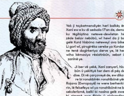
"Ger dilê Kurd xwe bihêle xwe-ber, Zîmanê xwe bê, wê xweyî nêder."

Wî Kurdî ne tenê wekî amûrêkî peywendîyê di, lê wekî bîngeha nasnameyê û fîlê nas kir. Bi vî awayî, Xanî dikare wekî pêşengê felsefeya zîmanê nûjen were hesibandin. Gotîna wî ya navdar: